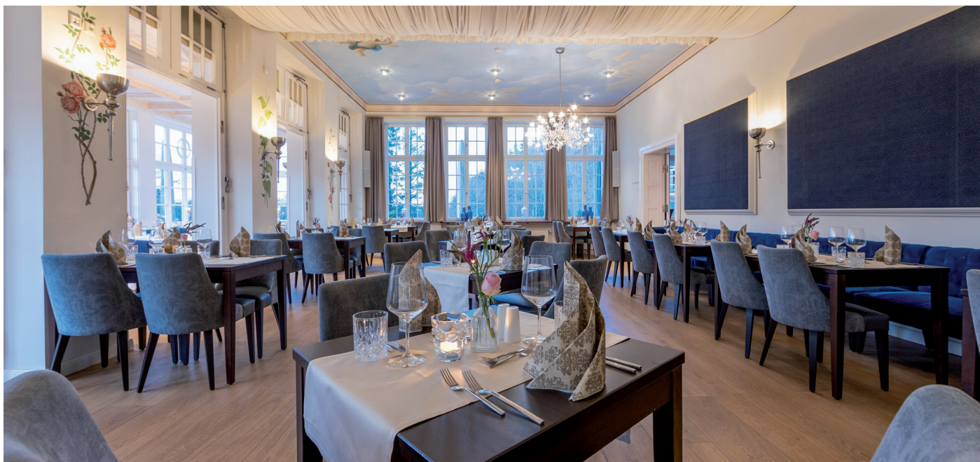
Auf eine schöne Abendveranstaltung im Restaurant „Taut's“ des Hotels Ettershaus dürfen sich alle Golferinnen und Golfer freuen, die nächsten Sonntag an unserem ersten großen Turnier teilnehmen. Ab 9 Uhr dürfen bis zu 80 Teilnehmende starten.