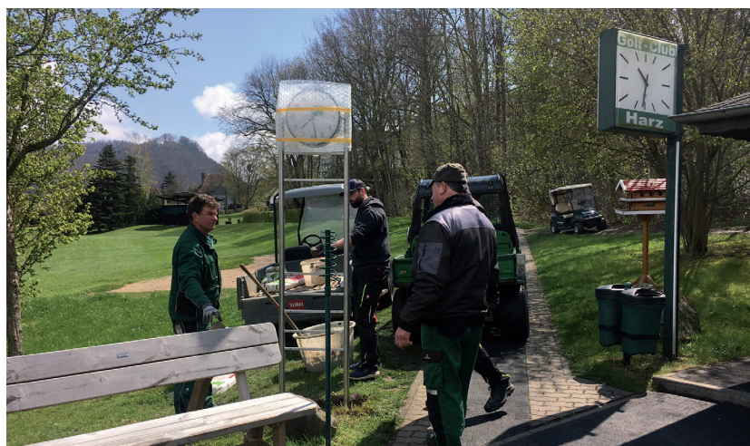
Die neue Edelstahl-Uhr wurde sicher in einem Betonbett aufgestellt. Die zusätzlichen vier Werbeflächen sind bereits verkauft.

und finanziert sich selbst über die verkauften Flächen. Die Schilder sind in Arbeit und werden in den nächsten Wochen montiert. Der elektrische Anschluss soll kurzfristig erfolgen. In den letzten zwei Jahren sind insgesamt 65 Werbepartner für den Club gewonnen worden.