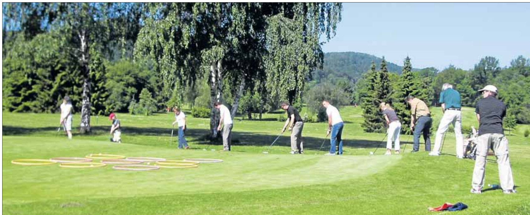
Die Gewinner des Golf-Schnuppertrainings nähern sich dem Sport im Wortsinn mit Chippen und Putten an.